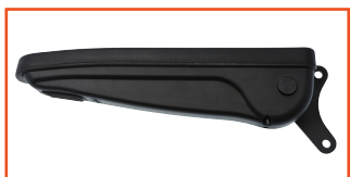
Accoudoirs Be-Ge Restflex Art.no.: 623321, 623322

Les accoudoirs Be-Ge Jany disposent d'une largeur totale de 64 mm.