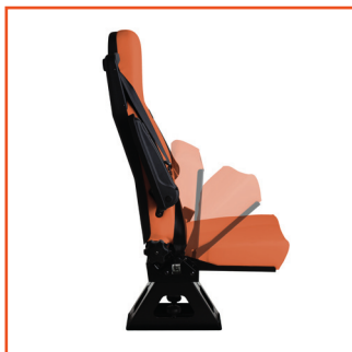
Tip-Up Art.no.: 48550