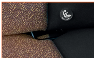
ISOFIX Art.no.: 48899