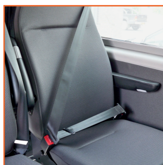
Siège à deux boucles de fixation JANY 801 art.no.: 49416 JANY 805 art.no.: 49399