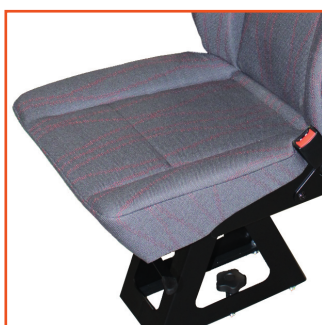
Wide Safety Seat

Livré d'origine avec ceinture de couleur noire. Orange sur demande.