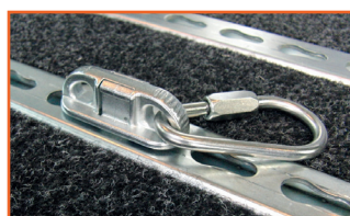
Fixation rapide sur Twinplate Art.no.: 50266