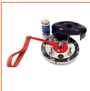
Embbase pivotante en aluminium Série 49000