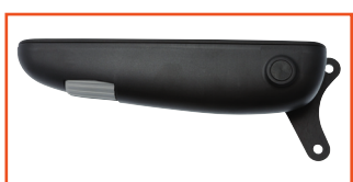
Accoudoirs Be-Ge Jany Art.no.: 6621, 6622

Cette option est disponible pour le JANY 862 Seamless